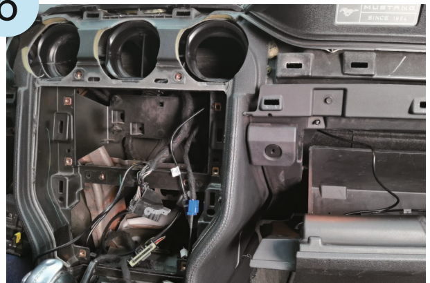
Anschluss der USB-Verlängerungs- kabel