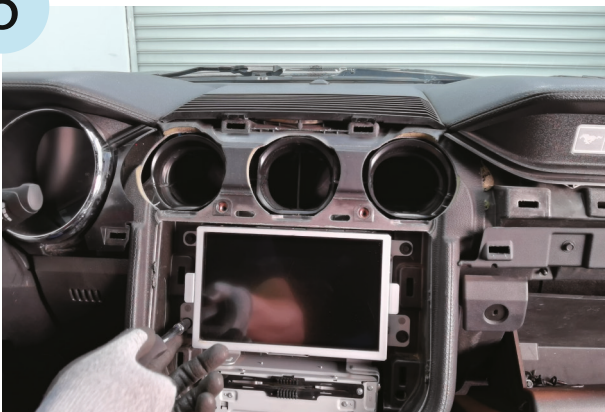
Remove the display screen screws