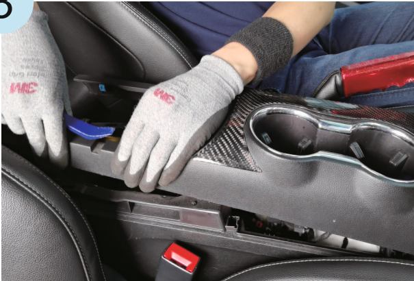
Pry up the armrest box