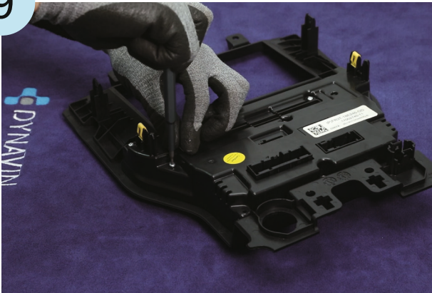
Die Schrauben entfernen