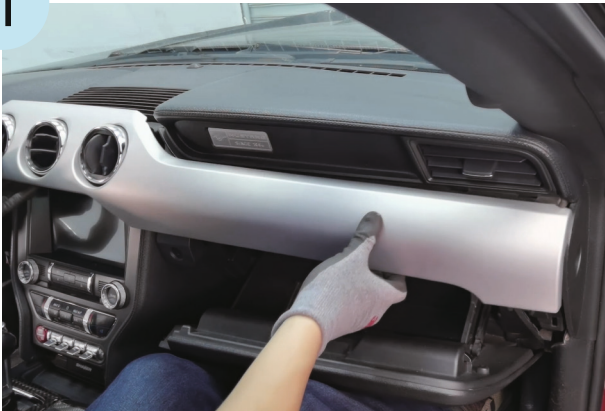
Die Frontblende entfernen