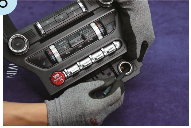
Den Original-Zigarettenanzünder entfernen