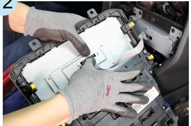
Dynavin Display mit Haupteinheit verbinden