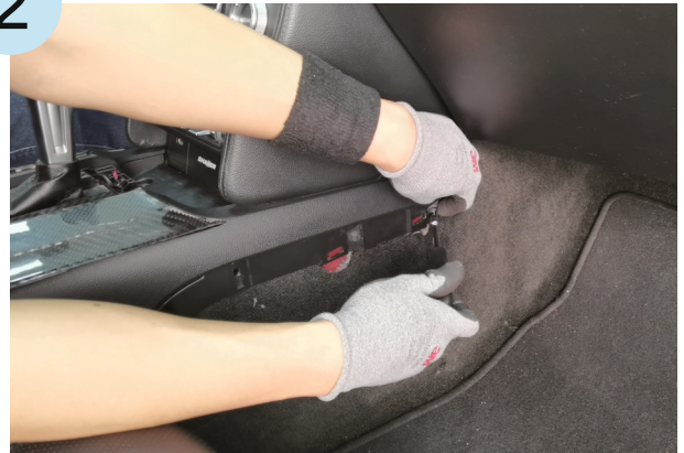
Die linke und rechte Seitenverkleidung sowie deren Schrauben entfernen