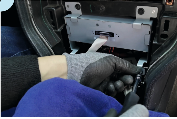
Dynavin Haupteinheit installieren