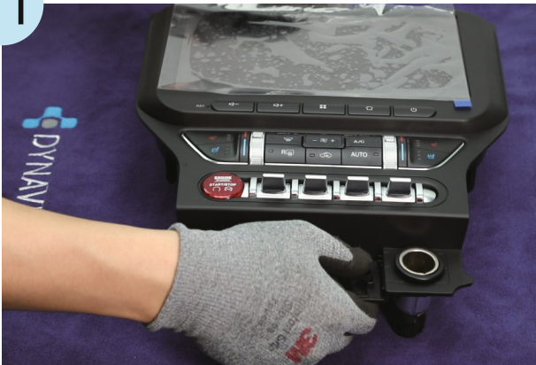
Original-Fahrzeugteilen auf die Dynavin-Blende einsetzen