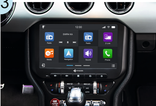
Die Installation ist vollständig