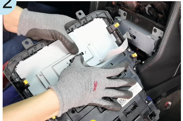
Dynavin screen to main unit connection